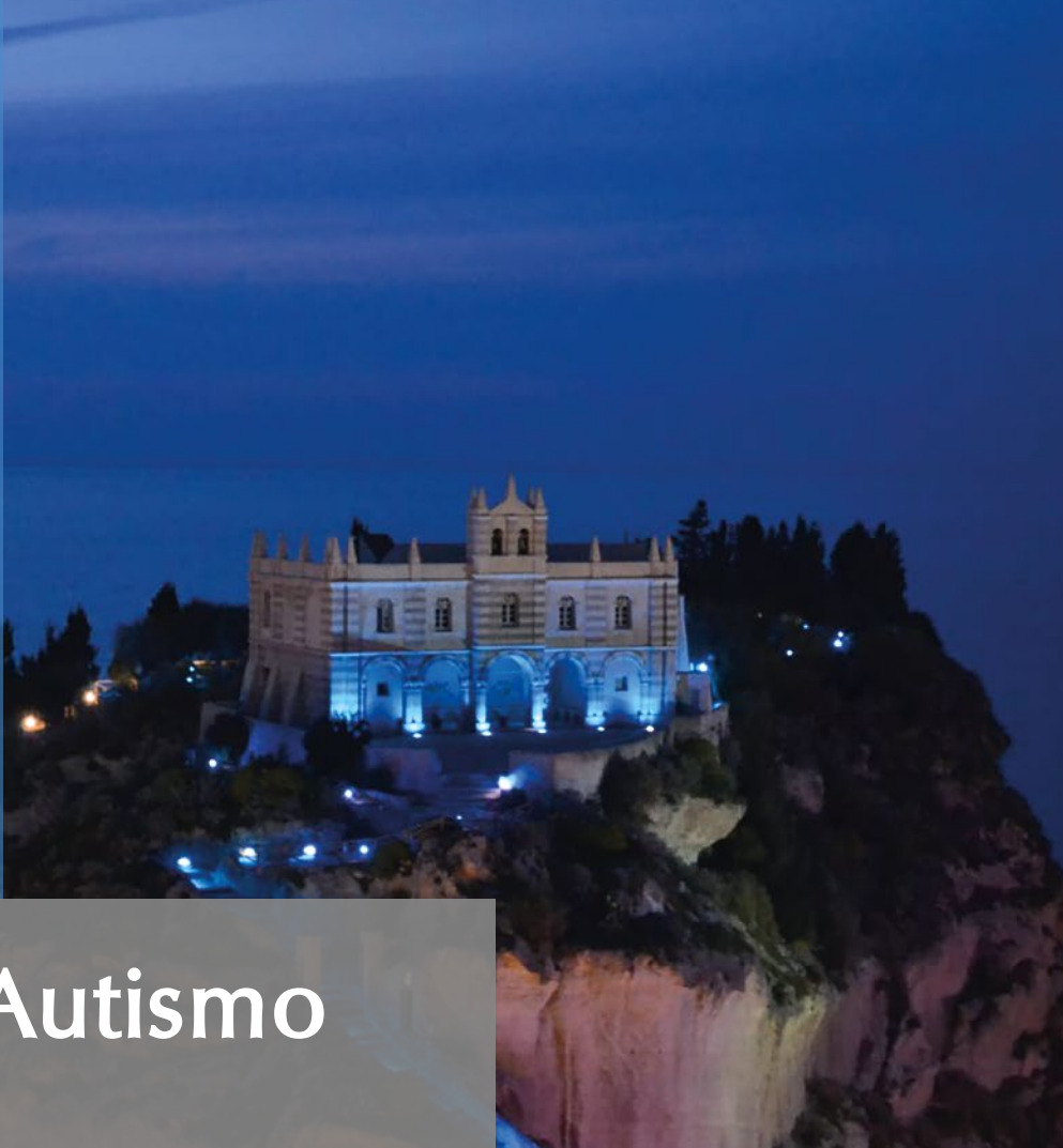
CHIESA DI SANTA MARIA DELL'ISOLA DI TROPEA - CALABRIA